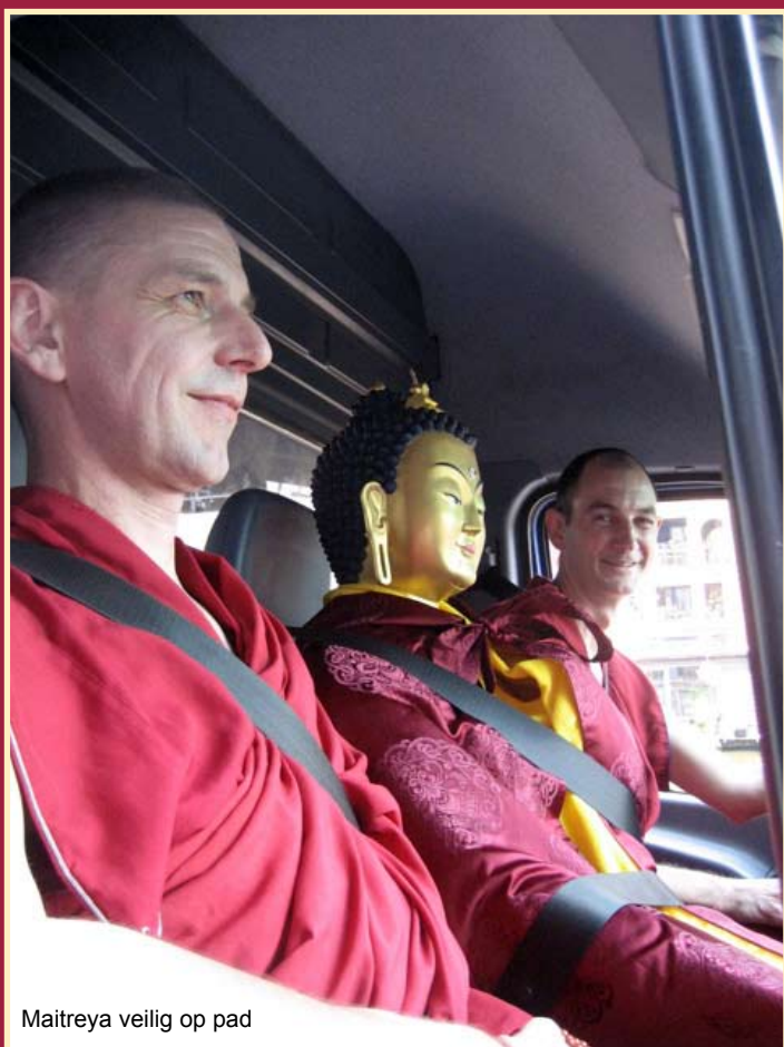
Maitreya veilig op pad

Periodieke nieuwsbrief voor leden van het Maitreya Instituut