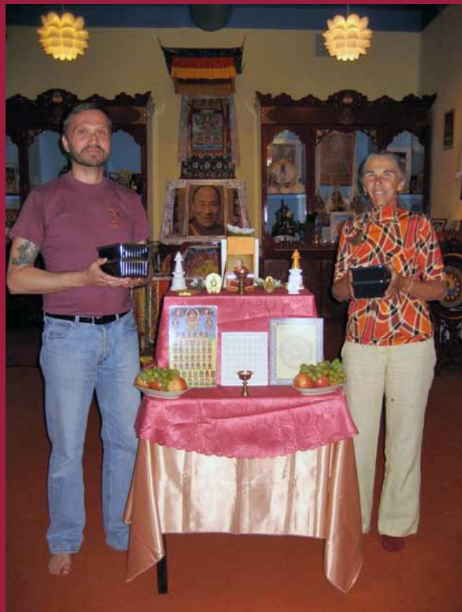
Eerste dierenbevrijding in Amsterdam.

Periodieke nieuwsbrief voor leden van het Maitreya Instituut