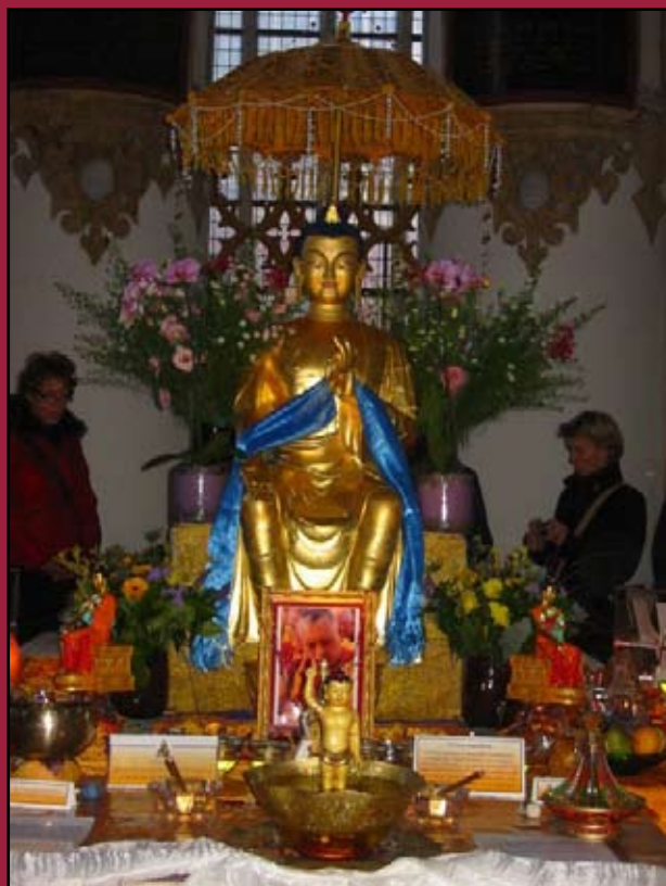
Heart Shrine Relics Tour in Groningen.

Periodieke nieuwsbrief voor leden van het Maitreya Instituut