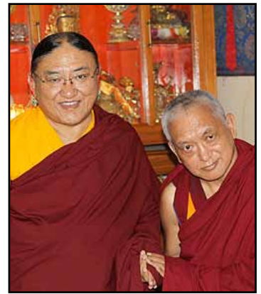
Zijne Heiligheid De Sakya Trizin en Lama Zopa Rinpoche

Stichting Sakya Thegchen Ling Laan van Meerdervoort 200a 2517 BJ DEN HAAG.