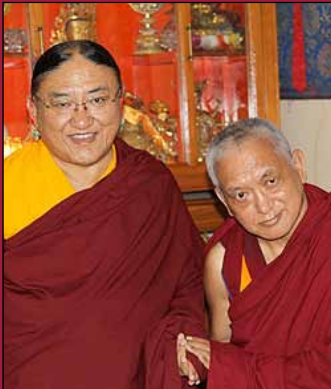
Zijne Heiligheid De Sakya Trizin en Lama Zopa Rinpoche

Periodieke nieuwsbrief voor leden van het Maitreya Instituut