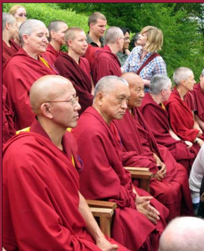
CPMT 2009: deel van de groepsfoto

Periodieke nieuwsbrief voor leden van het Maitreya Instituut