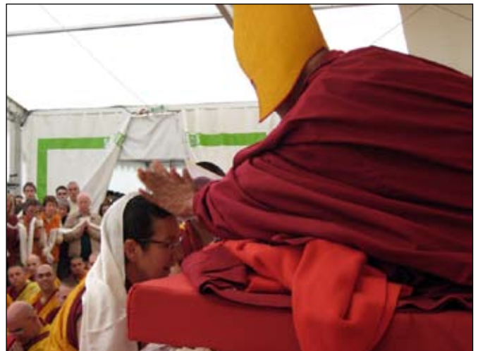
Lang Leven Poedja voor Lama Zopa Rinpoche.