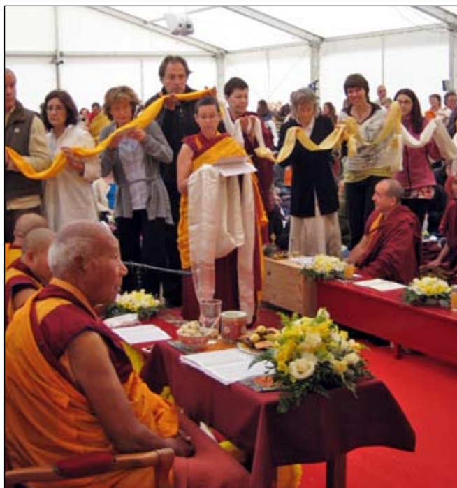
Lang Leven Poedja voor Lama Zopa Rinpoche.

Het belangrijkste wat er voor mij uitkwam, was inspiratie en de vastberadenheid om nooit het werk voor anderen te opgeven. Soms zijn we gevangen in onze eigen kleine wereld, ons eigen centrum en de moeilijkheden, en vergeten we de uitgebreide visie van FPMT om alle voelende wezens te helpen. We vergeten de ongelooflijke inzet van duizenden mensen over de hele wereld om die visie in de praktijk te brengen.