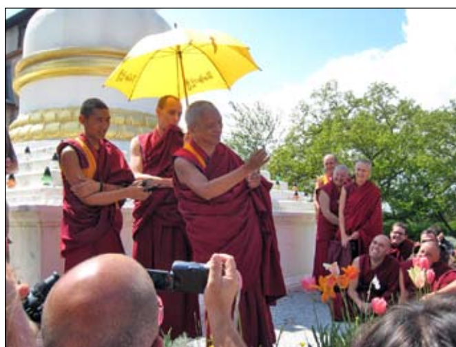
uitleg van Rinpoche over de voordelen van offergaven aanbieden en al is het maar 1 bloemetje!