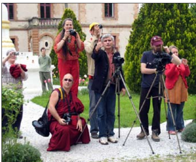
fotografen voor de CPMT groepsfoto