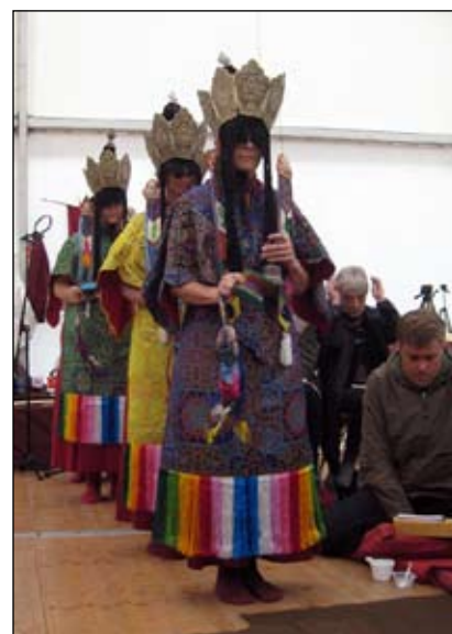
De 5 dakini's tijdens de Lang Leven Poedja voor Rinpoche aangeboden aan het einde van de CPMT.

3) een standaard om te hanteren binnen FPMT.