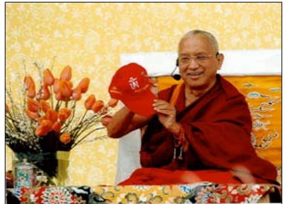
Uitleg Om Mani Padme Hum.

Voor mij, als nieuwbakken directeur, een fantastische gelegenheid een week lang te genieten van de aanwezigheid van Rinpochee, nieuwe mensen te leren kennen en meer te leren over de FPMT.