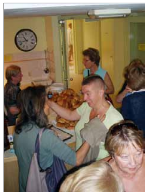
Bij de bar.