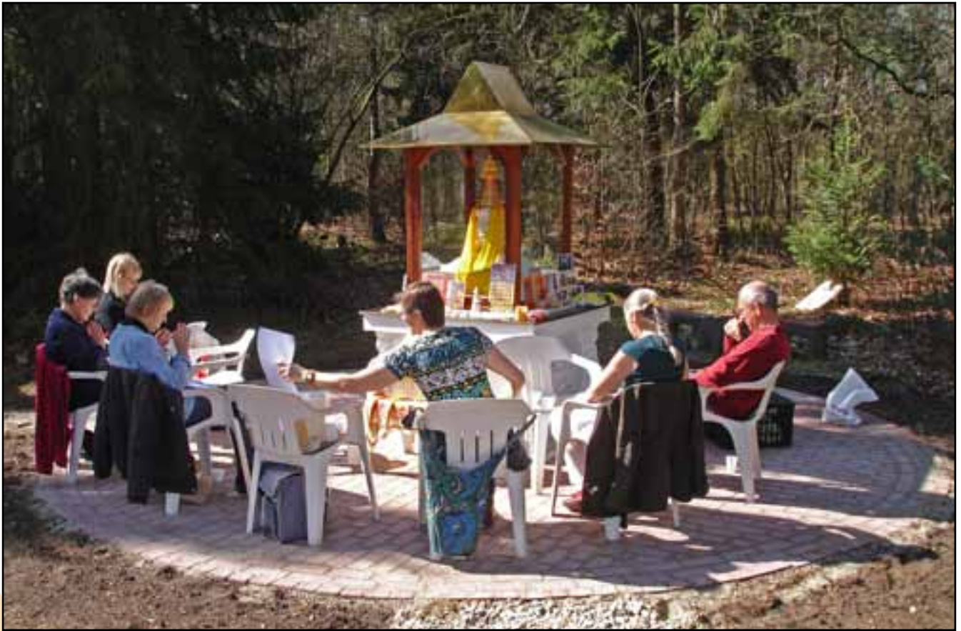
Deelnemers aan het dierenritueel genieten van de nieuwe stoepa en het mooie lenteweer in Emst.